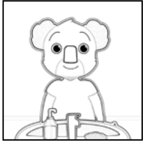
Pictogramme à découper 3,7 cm